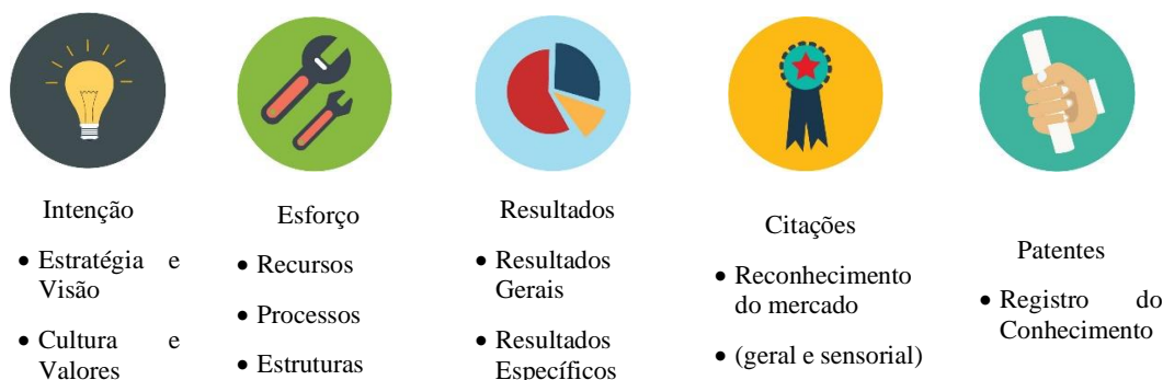
Figura 1 - Pilares metodológicos do Prêmio Valor Inovação Brasil

de inovar, esforço para realizar a inovação, resultados obtidos, avaliação do mercado e geração de conhecimento.